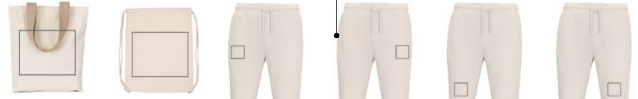
Totebag. (Max 26x24cm) Bolsa saco. (Max 26x24cm) Camal derecho. (Max 9x9cm) Camal izquierdo. (Max 9x9cm) Camal derecho bajo. (Max 9x9cm) Camal izquierdo bajo. (Max 9x9cm)