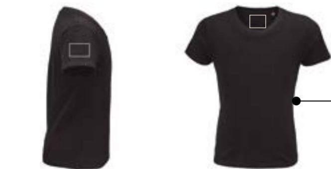
Manga izquierda. (Max 8x5cm) Etiqueta cuello. (Max 6x6cm)