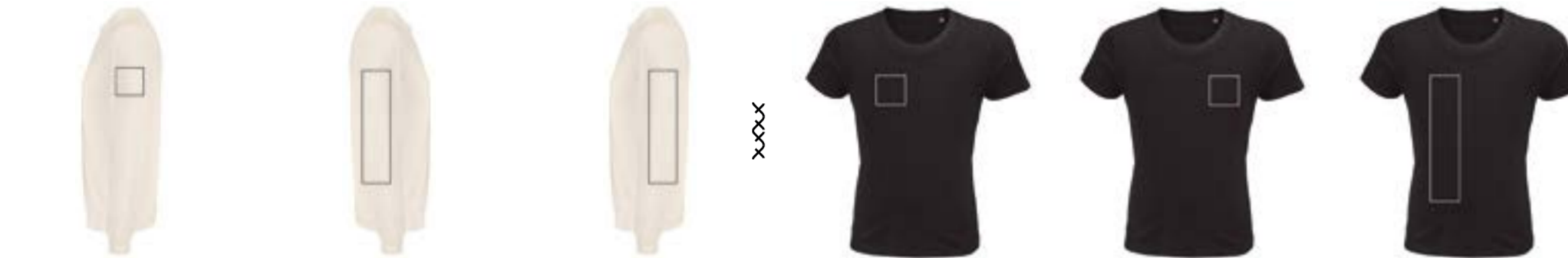
Manga izquierda. (Max 8x8cm) Manga derecha. (Max 8x32cm) Manga izquierda. (Max 8x32cm) Delante derecha. (Max 9x9cm) Delante izquierda. (Max 9x9cm) Delante derecha. (Max 8x29cm)