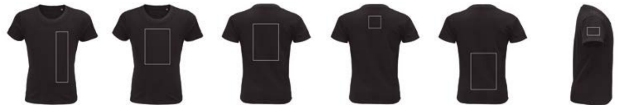
Delante izquierda. (Max 8x29cm) Delante centrado. (Max 21x29cm) Espalda centrado. (Max 21x29cm) Espalda centrado. (Max 9x9cm) Espalda bajo. (Max 21x29cm) Manga derecha. (Max 8x5cm)