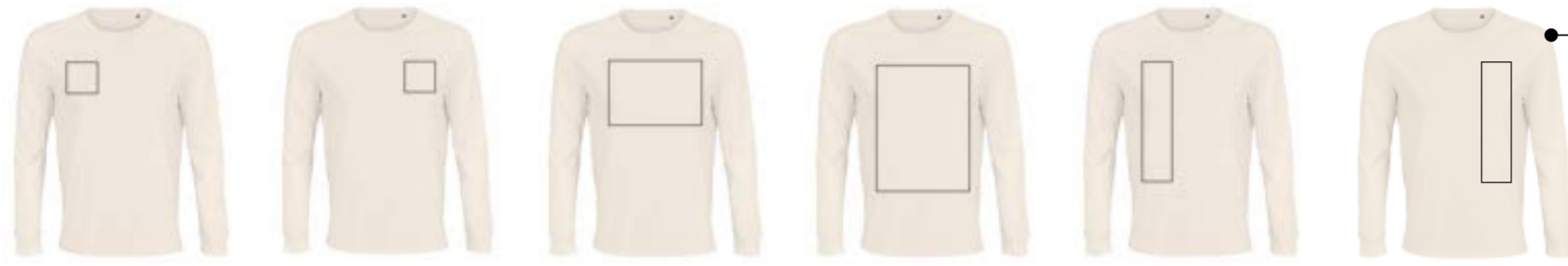
Delante derecha. (Max 9x9cm) Delante izquierda. (Max 9x9cm) Delante centrado. (Max 29x21cm) Delante centrado. (Max 27x32cm) Delante derecha. (Max 9x32cm) Delante izquierda. (Max 9x32cm)