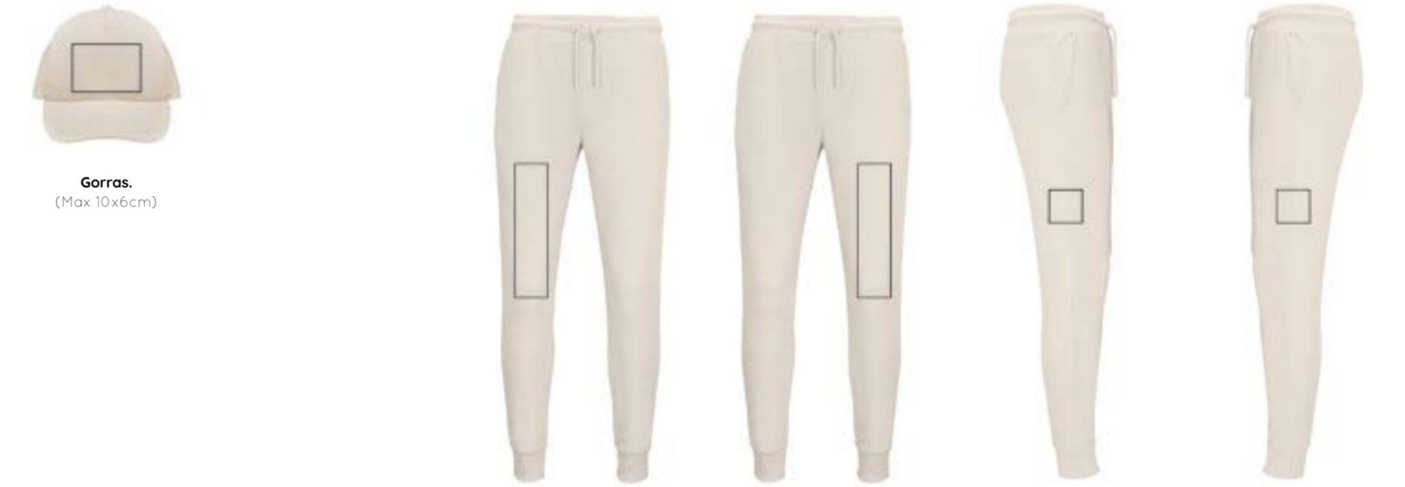
Gorras. (Max 10x6cm) Camal derecho. (Max 9x32cm) Camal izquierdo. (Max 9x32cm) Sobre bolsillo derecho. (Max 9x9cm) Sobre bolsillo izquierdo. (Max 9x9cm)