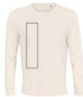
Delante derecha. (Max 9x33cm)