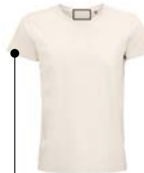
Etiqueta cuello. (Max 6x6cm)