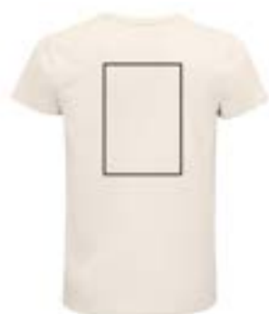
Espalda centrado. (Max 21x29cm)