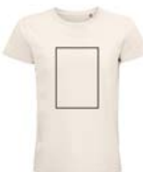
Delante centrado. (Max 21x29cm)