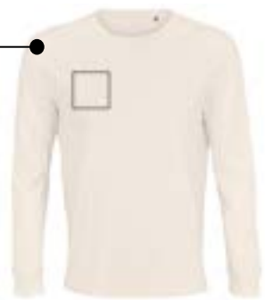
Delante derecha. (Max 9x9cm)