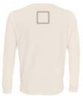
Espalda centrado. (Max 9x9cm)