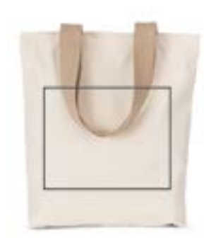
Totebag. (Max 26x24cm)