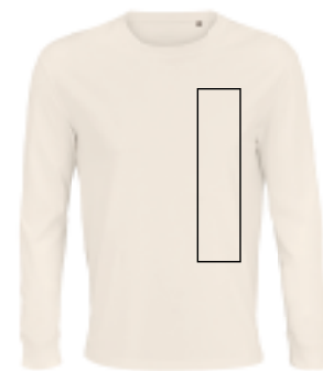
Delante izquierda. (Max 9x33cm)