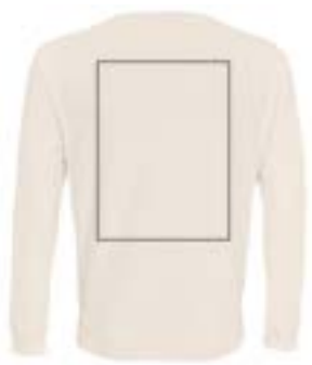
Espalda centrado. (Max 29x33cm)