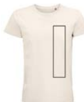
Delante izquierda. (Max 8x29cm)