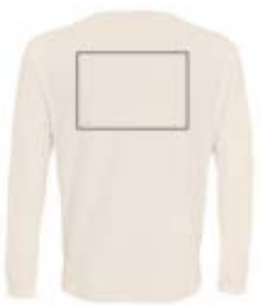
Espalda centrado. (Max 29x21cm)