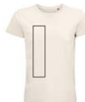
Delante derecha. (Max 8x29cm)