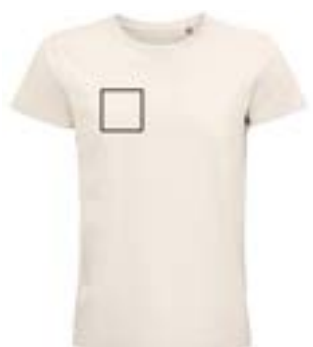
Delante derecha. (Max 9x9cm)