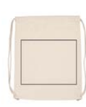
Bolsa saco. (Max 26x24cm)