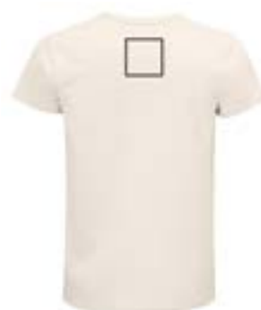
Espalda centrado . (Max 9x9cm)