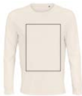
Delante centrado. (Max 29x33cm)