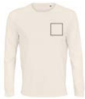
Delante izquierda. (Max 9x9cm)