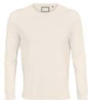
Etiqueta cuello. (Max 6x6cm)