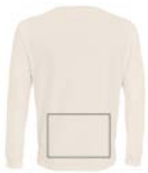
Espalda bajo. (Max 29x21cm)