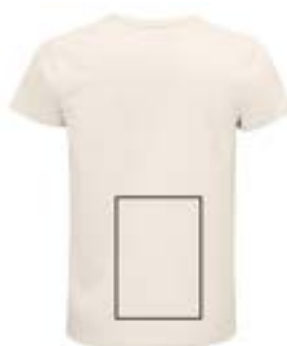
Espalda bajo. (Max 21x29cm)