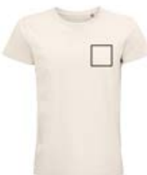
Delante izquierda. (Max 9x9cm)