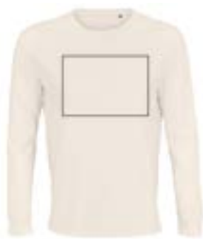
Delante centrado. (Max 29x21cm)